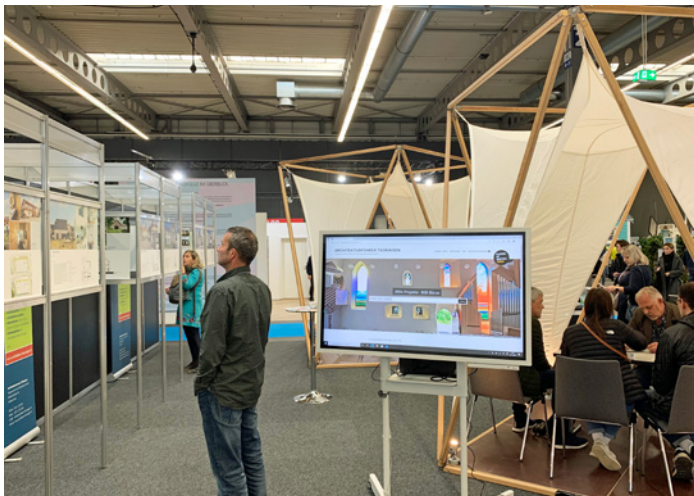
Neben den bewährten Pavillons von Studierenden der Bauhaus-Universität Weimar (entworfen unter Leitung von Prof. Jürgen Ruth und AKT-Mitglied Torsten Müller) zogen auch die Tafeln vom Tag der Architektur die Besucherinnen und Besucher auf den Stand der Kammer. Interessierte erhielten nicht nur Rat zu Hausbau, Umbau und Sanierung, sondern auch bei der Suche nach einem geeigneten Architekturbüro: Der Architekturführer Thüringen, den die Kammer auf einem Touch-Infopoint präsentierte, lieferte wertvolle Orientierung.

Die Kombination aus Haus.Bau.Ambiente. und artthuer besuchten über die drei Messetage hinweg nahezu 9.000 Gäste, wobei sich die Kunstmesse einmal mehr als Zugpferd für die Baumesse erwies.