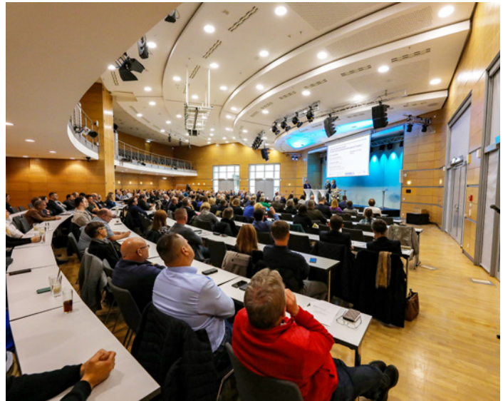
Gut gefüllt: Das Congress-Center der Messe Erfurt zählte rund 300 Teilnehmende